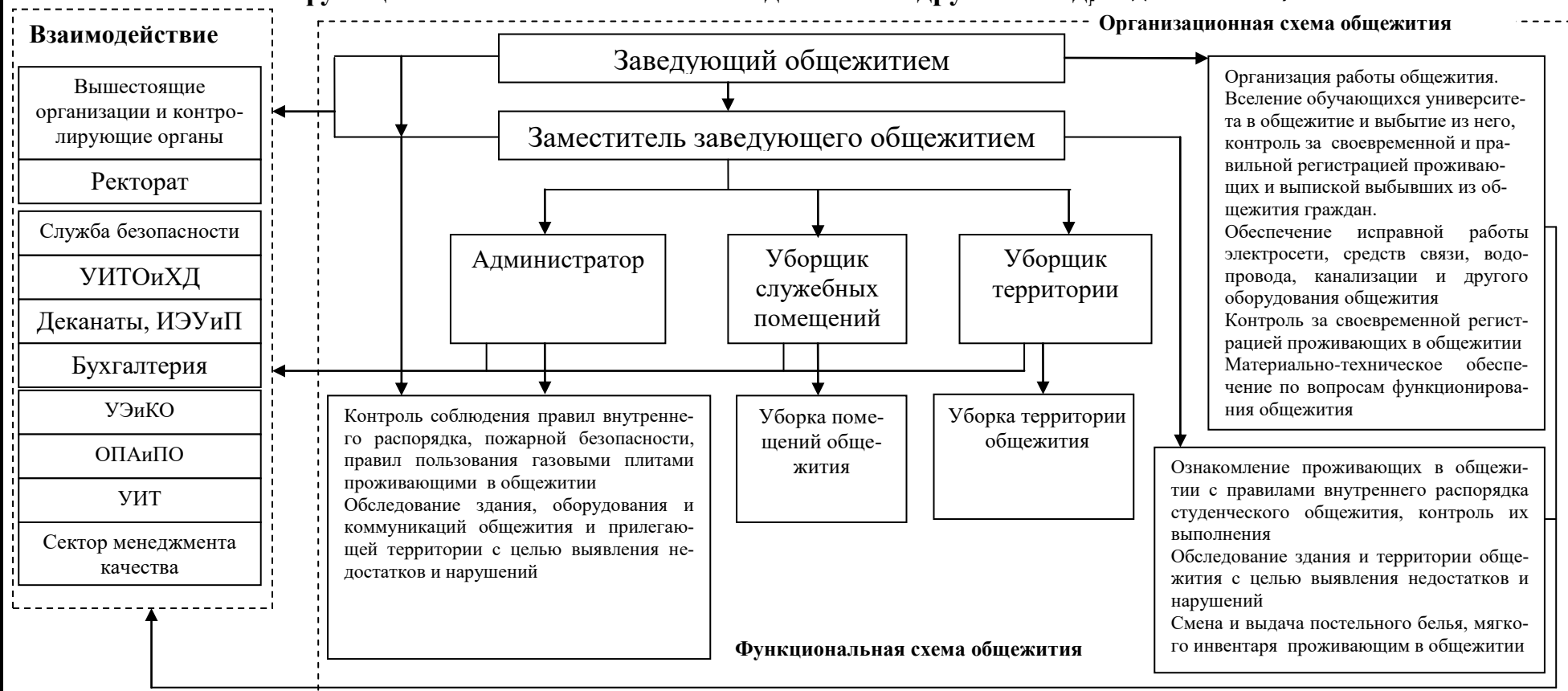
Схема подразделения (графическое описание структуры общежития, функциональных связей и взаимодействий с другими подразделениями)